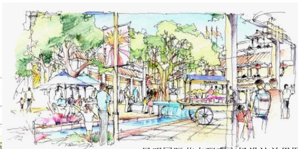
昆明国际花卉配套市场设计效果图