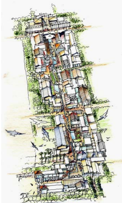
昆明国际花卉配套市场设计鸟瞰图